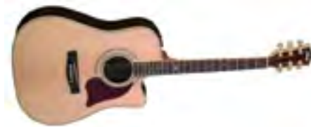
Fina Guitars FD-807 Гитара акустическая «Dreadnought» В/дека: ель Н/дека и обечайки: палисандр Накладка на гриф: палисандр Цвет: Natural Gloss Струны: D'Addario