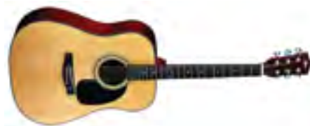
Fina Guitars FD-802 Гитара акустическая «Dreadnought» В/дека: ель Н/дека и обечайки: красное дерево Накладка на гриф: палисандр Цвет: Natural Gloss Струны: D'Addario