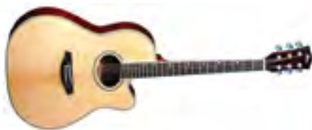
Fina Guitars FA-668C Гитара акустическая «Grand Auditorium» В/дека: ель Н/дека и обечайки: красное дерево Цвет: Natural Gloss Покрытие: лак Струны: D'Addario

Под брендом Fina выпускается около 100 моделей гитар, из которых каждый желающий может подобрать себе гитару по вкусу. В ассортименте Fina найдется гитара, как для начинающего музыканта, так и для профессионала, как для ребенка, так и для любителя поиграть на гитаре около костра. Каждая модель тщательно разрабатывалась под определенные цели.