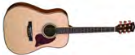
Fina Guitars FD-810 Гитара акустическая «Dreadnought» В/дека: ель Н/дека и обечайки: красное дерево Накладка на гриф: палисандр Цвет: Natural Satin Струны: D'Addario EXP