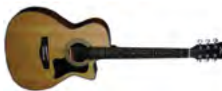
Fina Guitars FGC-706C Гитара акустическая «Grand Concert» В/дека: клен Н/дека и обечайки: красное дерево Цвет: Natural Gloss Покрытие: лак Струны: D'Addario С вырезом