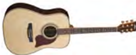
Fina Guitars FD-3150 Гитара акустическая «Dreadnought» В/дека: ель Н/дека и обечайки: палисандр Накладка на гриф: палисандр Цвет: Natural Gloss Покрытие: лак Струны: D'Addario EXP