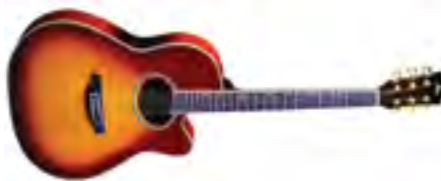
Fina Guitars FA-668CTY Гитара акустическая «Grand Auditorium» В/дека: ель Н/дека и обечайки: красное дерево Цвет: Tobacco Yellow Gloss Покрытие: лак Струны: D'Addario