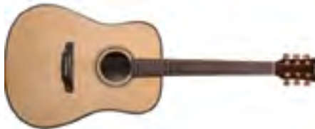
Fina Guitars FD-812 Гитара акустическая «Dreadnought» В/дека: ель Н/дека и обечайки: Dao Накладка на гриф: палисандр Цвет: Natural Satin Струны: D'Addario