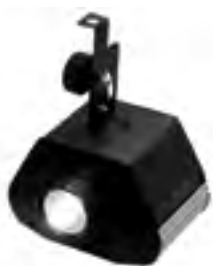
LED PINSPOТ 10W

Ассортимент продукции фирмы Led Star пополнен пятью новыми моделями.